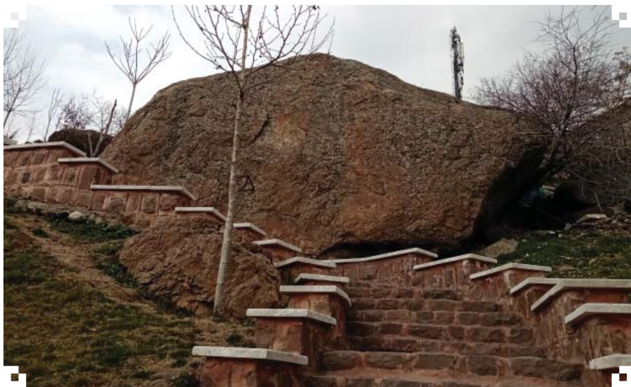
تصویر ۷. پلکان فضای سبز در دامنه شرقی سیمین قلعه

ایجاد پارک‌های خطی در کناره‌های رود (بوستان ساحلی دارآباد) توانسته ساماندهی خوبی انجام دهد. نوسازی بدون اندیشه، عدم آشنایی و ضعف قانونی میراث فرهنگی باعث صدمات جبران‌ناپذیری به محوطه‌های تاریخی شمیران شده است. ورود شورای شهر، نهادهای غیر دولتی و سرای محله‌ها می‌تواند توجه به منظرهای فرهنگی و تاریخی شمیران را بازتعریف کند. بدین منظور باید در کنار بالا بردن استاندارد زندگی شهری رویکرد حفاظت از هویت فرهنگی شکل گیرد و با کاوش، بازسازی، تعیین عرصه و حریم، تخریب سازه‌های غیرمرتبط و ایجاد یک موزه از آثار فرهنگی شمیران مانند تپه قیصریه در سیمین قلعه بنیان نهاده شود.