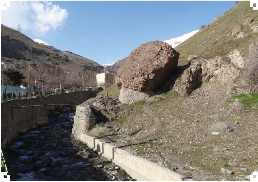
تصویر ۴. صخره سرخ رنگ از میراث طبیعی مسیر رود دره دارآباد

روز بیست و چهارم مرداد ۱۳۱۶ شمسی افتتاح شد و محل آن ابتدا در قصر قدیمی مظفرالدین شاهی بود (ستوده، ۱۳۷۱: ۳۶۴). بیمارستان مسیح دانشوری در حال حاضر بنایی است متشکل از دو بخش قدیمی و جدید، در شمال شرقی دارآباد و در انتهای خیابان پور ابتهاج و ابتدای خیابان هاشمی، در زمینی به مساحت ۵ هکتار و زیر بنای ۲۴۰۰۰ مترمربع واقع شده، و دارای ۱۸ ساختمان، ۱۲ بخش و ۱۳ درمانگاه است (دانشنامه تهران، ۱۳۹۲، جلد دوم: ۳۹۴).