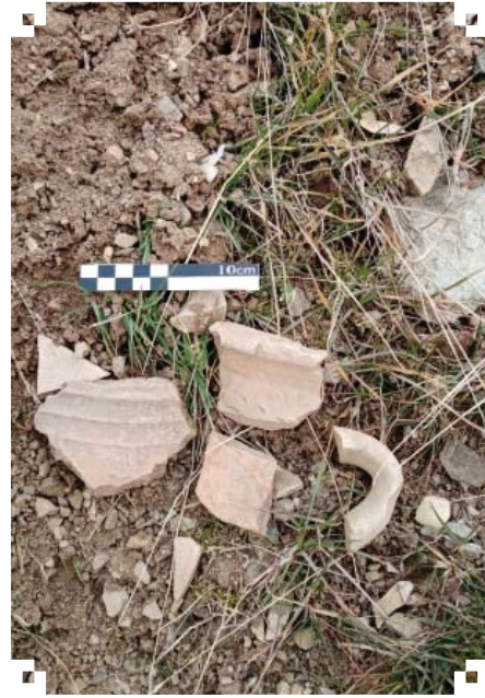
تصویر ۵ و ۶ سفال‌های تاریخی در محوطهٔ سیمین قلعه دارآباد

مسجد جامع دارآباد مسجد جامع دارآباد در خیابان پور ابتهاج کوچک مسجد جامع واقع شده است، در دامنهٔ جنوبی محله و در شیب به نسبت تند قرار گرفته و سه در ورودی دارد. با چندین پله به درب شمالی و غربی آن می‌رسیم که بنای آن به اواخر قاجار بازمی‌گردد. در سوم در قسمت جنوب و ورودی مسجد تازه‌ساخت است که نمای امروزی دارد.