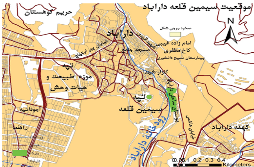
نقشه ۱. موقعیت سیمین قلعه دارآباد