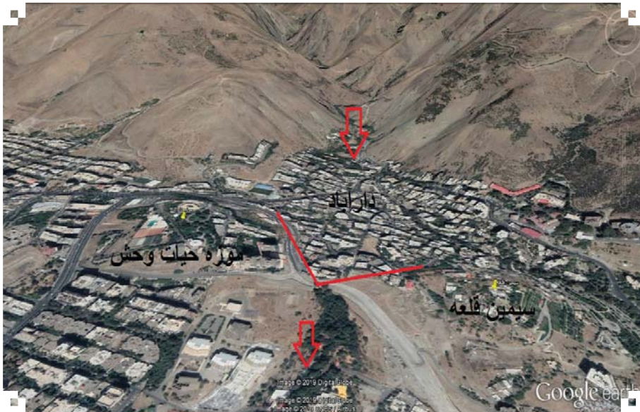
تصویر ۲. موقعیت رودره دارآباد و رسوب‌گذاری‌های بین تپه سیمین قلعه و تپه موزه حیات وحش.

گونه‌های گیاهی در شمال تهران از تنوع بالایی برخوردار است، کوهستان شمیران ۴۵۰ گونه گیاهی دارد و ۷۲ گونه آن آلباین بالای ۳۰۰۰ متر و ۱۰ درصد آن انحصاری توچال است. دارآباد جزو پروانس ایران-تورانی طبقه‌بندی می‌شود (محرابیان و همکاران، ۱۳۸۴: ۲).