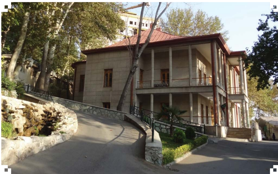
تصویر ۸. کاخ مظفری

محوطه‌های پیش از تاریخ حوزه شمیران از جمله تپه قیطریه، تپه لویزان و دشت تهران پاسخ داد. با توجه به مدیر توانا و تاریخ‌شناس بیمارستان مسیح دانشوری می‌توان امید داشت اطراف محوطه امامزاده غیبی هم مورد گمانه‌زنی قرار گیرد و