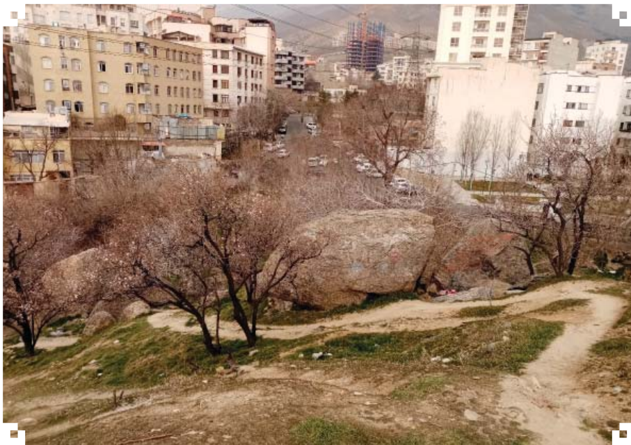
تصویر ۳. صخره در شیب تپه

پنجمین پادشاه قاجار، مظفرالدین شاه بنا شده است. این قصر در سال ۱۳۲۱ قمری ساخته شد و از آن تاریخ نام دارآباد رو به فراموشی رفت و نام شاه‌آباد جایگزین آن شد (ستوده، ۱۳۷۱: ۳۶۵). کاخ مظفری کتیبه‌ای مرمرین دارد که در ابتدای راهرو طبقه دوم آن نصب شده، بدین شرح است: «بسم الله الرحمن الرحيم . در سنه ۱۳۱۹ اودنیل باغ شاه‌آباد به توسط میرزا علی اصغر خان امین‌السلطان خریداری شد و در باری نیل سنه ۱۳۲۰ به توسط میرزا محمود خان حکیم‌الملک، وزیر دربار بنای عمارت شد. عمل خانه‌زاد حسین حجار» (دانشنامه تهران، ۱۳۹۲، جلد دوم: ۴۲۳). این سازه به شماره ۳۷۹۲ در سال ۱۳۸۰ به ثبت میراث فرهنگی رسیده است (تصویر ۸).