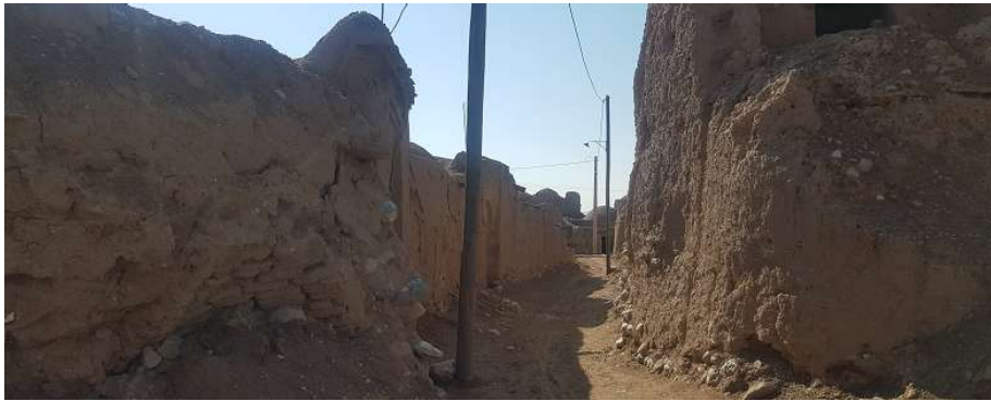
تصویر ۴. گذر اصلی بافت قدیم روستا که از وسط بافت عبور می‌کند و در دو طرف آن فضاهاى مسکونی ساخته شده است (عکس از حسین جوان، ۱۳۹۸)

اقلیمی از مواد و مصالحی استفاده کرده‌اند که با محیط خود سازگاری داشته باشد و با ساختن جرزها و دیوارهای ستبر خشتی به راحتی نفوذ سرما و گرما را به داخل بنا، سد سازند.