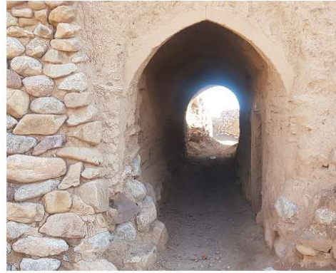
تصویر ۱۱. نمونه‌ای از ساباط‌های بافت قدیم روستای تیغدر (عکس از حسین جوان، ۱۳۹۸)

زمستان و تابستان و همین‌طور نگهداری دام و علوفه و سایر نیازها ساکنان ساخته شده، بر اثر تابش شدید آفتاب و سایر عوامل اقلیمی که اشاره شده سقف همه فضاهای مسکونی گنبدی و دیوارهای قطور و همین‌طور خانه‌های حیاط دار با حوض آب و درختکاری است و خانه‌هایی که از سه جهت با خانه‌های دیگر احاطه شده و فقط یک ضلع آنها در معرض تابش خورشید قرار داشته، همه از فضای به نسبت وسیع مستطیل شکل برخوردارند. معماران بومی با توجه به شرایط اقلیمی از مواد و مصالحی استفاده کرده‌اند که با محیط خود سازگاری داشته باشد و با ساختن جرزها و دیوارهای ستبر خشتی به راحتی نفوذ سرما و گرما را به داخل بنا سد سازند. معمولاً از لحاظ ارتفاع فضاهای مسکونی در یک اندازه ساخته می‌شود. از جمله اینکه اکثر فضاهای مسکونی دارای تنوری داخل خانه‌ها و به‌ندرت دیده می‌شود، داخل کوچه‌های بافت این فضا تعبیه شده باشد. اکثر خانه‌ها مسکونی بافت قدیم روستای تیغدر در دو طبقه و اطراف یک حیاط کوچک ساخته شده است و از آنجاکه در گذشته چند خانواده در یک خانه زندگی می‌کرده‌اند، این خانه دارای