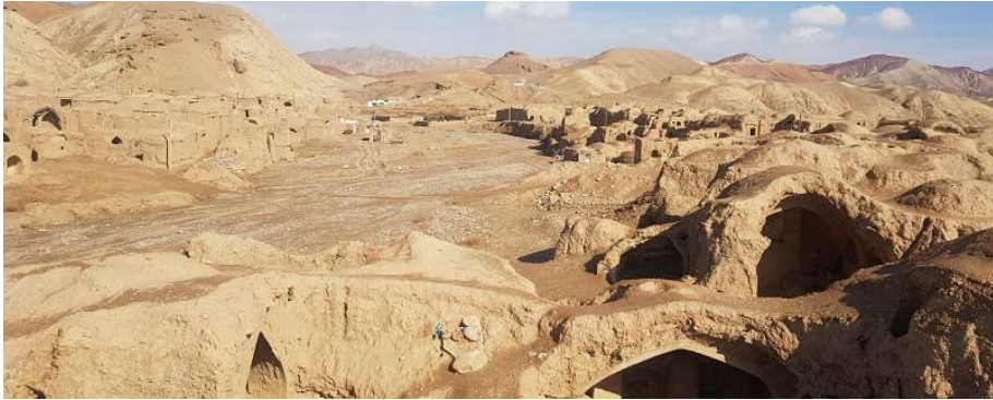
تصویر ۳. بافت قدیم روستای تیغدر- دید از جنوب شرق

این بافت‌های تاریخی در سیر تحول خود ضمن انطباق با شرایط موجود ساخت و بافت ارگانیک خود را حفظ نموده و آن را در پهنه شهر و روستا نگه داشته‌اند؛ به گونه‌ای که امروزه به عنوان قلب آن شهر و آبادی از لحاظ فعالیت‌های مختلف محسوب می‌شود.