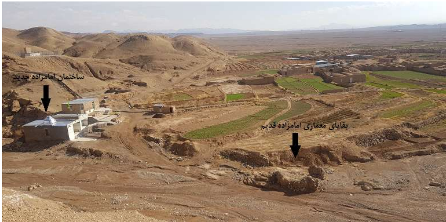
تصویر ۱۵. موقعیت آرامگاه جدید و قدیم بی‌بی عصمت و بی‌بی عفت

می‌باشد. همچنین در ساخت گذرهای روستا نیز دارای کوچه‌های پر و پیچ و خم، کم عرض و ساباط‌های جهت آسایش ساکنان بافت ساخته شده است. برای پوشش بناها از انواع قوس‌ها از جمله، قوس‌های جناغی، خنچه‌پوش، هلالی و... که با خشت خام و به ندرت آجر پوشش شده است. انواع پوشش‌ها مانند طاق، گنبد و کاربندی هر کدام در جای خود و برای تامین کارکردی معین مورد استفاده قرار می‌گرفت. در پایان برای جلوگیری از تخریب و حفظ بناهای با ارزش بافت روستای تیغدر یکسری پیشنهادات ارائه می‌شود: