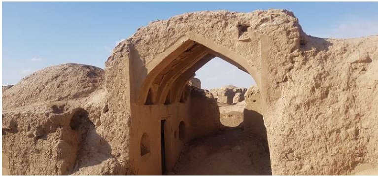
تصویر ۱۲. استفاده از طاق و نویزه در فضاهای معماری بافت قدیم روستای تیغدر