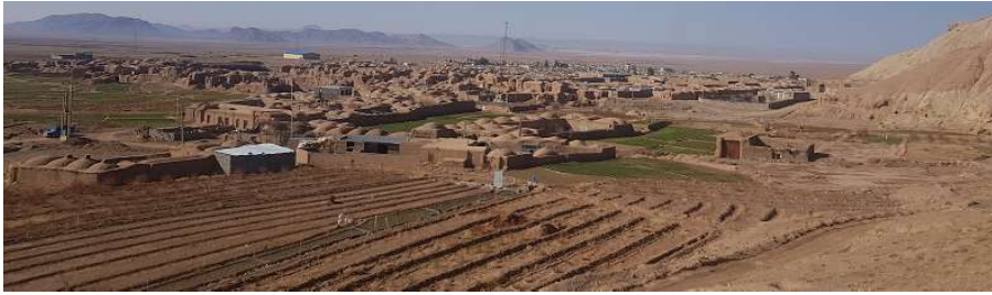
تصویر ۲. بافت قدیم روستای تیغدر- دید از شمال شرق (عکس از حسین جوان، ۱۳۹۸)