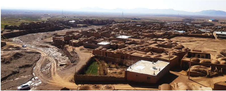
تصویر ۱. بافت قدیم روستای تیغدر - دید از شمال

درونی شهر است؛ آنچه را که به شهر در دوران تغییرات و تحولات اضافه می‌شود، بافت قدیمی می‌نامیم. بخش میانی در حاشیه بافت قدیم نه به کندی بافت قدیم و نه با سرعت شکل گرفته است.