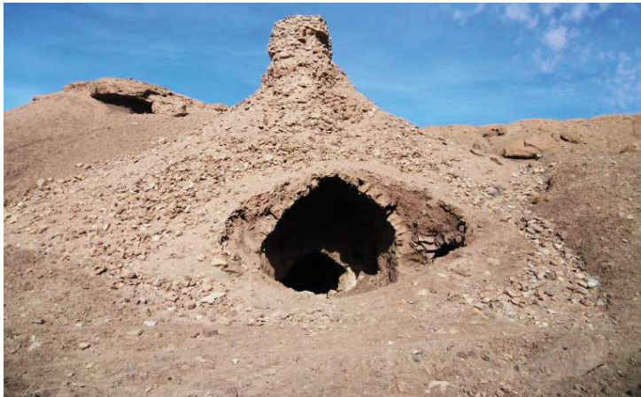
تصویر ۱۰. نمای کلی از فضاهای معماری و تنوره آسیاب قربان (عکس از حسین جوان، ۱۳۹۶)

طویله و... تشکیل شده است. قنات روستای تیغدر در گذشته آب فروانی داشته به طوری که در مسیر قنات روستای تیغدر که از شمال شرق روستا به سمت زمین‌های کشاورزی در امتداد است، چندین آسیاب به نام‌های آسیاب تُل او (آب) تیغدر، آسیاب سُرخو تیغدر، آسیاب بیگ تیغدر، آسیاب قربان (قربو، تصویر ۱۰) تیغدر، آسیاب میر سلیم تیغدر، آسیاب تَه رود تیغدر و آسیاب پایین تیغدر ساخته شده است. این آسیاب مربوط به مالکان خصوصی است و به مرور زمان و بر اثر حوادث طبیعی و انسانی این آسیاب رو به تخریب است که با مرمت آن می‌توان از نابودی آن پیشگیری کرد. سباباط: از جمله فرم‌های مورد استفاده در اقلیم گرم و خشک ساخت سباباط ۱ در گذرهاست. در گذشته سباباط به کلیه بناهایی که به منظور آسودن