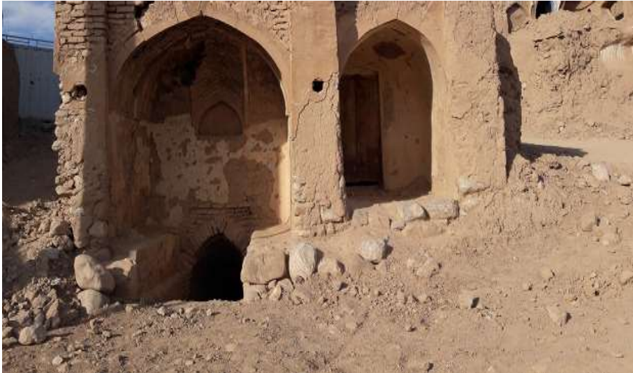
تصویر ۸. ایوان ورودی آب انبار محمدعلی و ورودی مسجد در کنار آب انبار (نگارندگان، ۱۳۹۶)