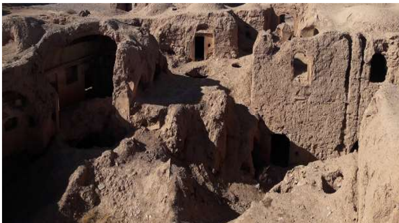
تصویر ۵. بقایای معماری قلعه بافت قدیم روستای تیغدر (نگارندگان، ۱۳۹۶)