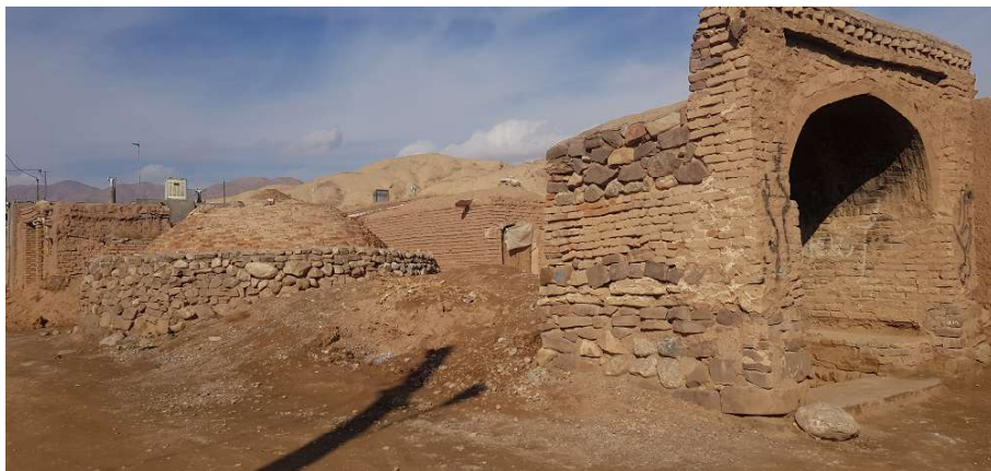
تصویر ۹. آب انبار حاجی

قرار گرفته است (تصویر ۶) از لحاظ وسعت و اندازه بزرگتر است و نسبت به دو آب انبار دیگر قدیمی تر است. از جمله نکات جالب توجه این آب انبار ساخت فضای کوچکی در سمت راست ایوان بنا به عنوان مسجد و استراحتگاهی برای ساکنان و مسافران است. این آب انبارها مربوط به دوره قاجار و پهلوی اول است. این آب انبار فاقد عنصر معماری شاخصی است و فقط در سردر آب انبار حاجی تزیینات آجرکاری به صورت دندان موشی به کار رفته است (تصویر ۹).