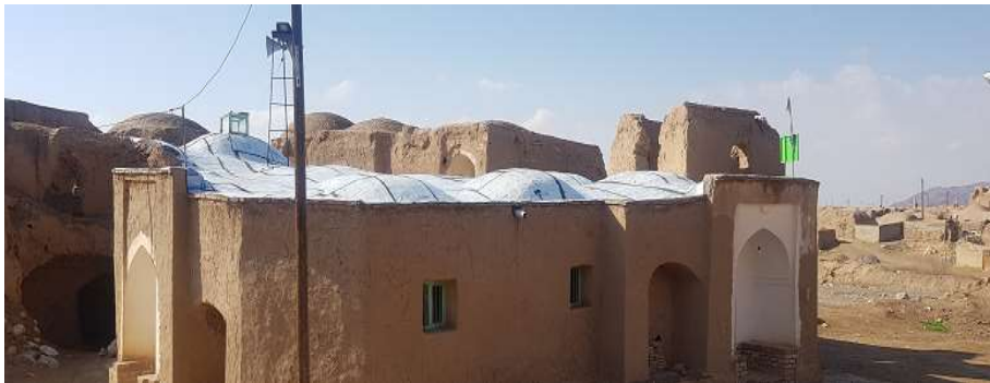
تصویر ۶. نمای کلی ایوان از مسجد بافت قدیم روستای تیغدر

محیطی در شهرها و محلات مسلمانان است (همان: ۳۴۵). مسجد بافت قدیم روستای تیغدر، با کارکرد مذهبی و عام‌المنفعه بوده است و در راستای شمال شرقی و جنوب غربی با ابعاد ۱۱ × ۱۳/۵ متر ساخته شده است. ورودی اصلی آن در ضلع شمال شرقی بناست که دارای ایوانی کم ارتفاع (۳/۵ متر) با طاق جناغی و دو سکوی نشیمن‌گاه درون ایوان است (تصویر ۶). علاوه بر این ورودی، ورودی دیگر در ضلع شرقی مسجد تعبیه شده است. این مسجد به صورت شبستانی در سه دهانه با ستون‌های مربع شکل با ارتفاع یک متر ساخته شده است. قوس‌ها از روی این ستون‌ها بر دیوار دو طرف سوارند. در پوشش شبستان از تاق جناغی استفاده شده است. مسجد فاقد تزیینات است و فقط در بعضی از قسمت‌ها طاقنماهایی با قوس جناغی درون دیوار ایجاد شده است. پوشش بنا گنبدی و در قسمت جنوب غربی محرابی ۱ فاقد تزیین با فرو رفتگی در درون دیوار کار شده است. حمام: حمام از جمله ابنیه مهم شهری و روستایی