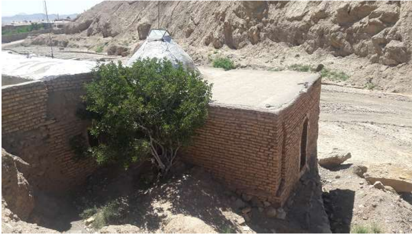
تصویر ۱۶. درخت انجیر امامزاده بی بی عصمت و بی بی عفت (نگارندگان، ۱۳۹۸)