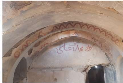
تصویر ۱۳. استفاده از نقاشی، آجرکاری دندان موشی، نقش‌های هندسی و گیاهی و شومینه در بافت قدیم روستای تیغدر

یکی از ویژگی‌های مهم معماری اسلامی ایران است. نکته دوم در مورد فن ساختمان این سازه است که نسبت به زمان خود روش پیشرفته‌ای است (معماریان، ۱۳۶۷: ۲۷). از جمله پوشش‌ها و قوس‌های تزئینی در بافت قدیم روستای تیغدر می‌توان به پوشش طاق هلالی، جناغی (تصویر ۱۲)، خنچه پوش و... اشاره کرد. از لحاظ تزئینات هم، تزئینات اندکی در معماری فضاهای بافت به کار رفته و در بعضی از اطاق‌ها تزئینات نقاشی (گیاهی و هندسی)، آجرکاری، گچبری و همین‌طور کاربردی و