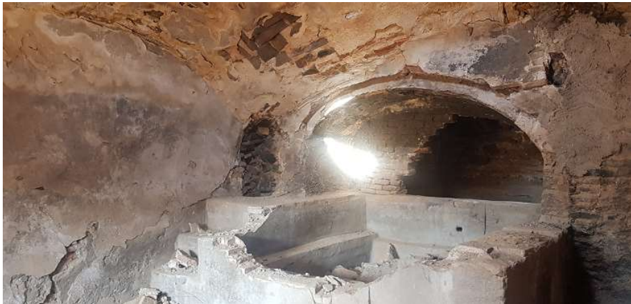
تصویر ۷. گرمخانه و خزینه حمام بافت قدیم تیغدر

محلات مختلف داشته است. اهمیت حمام و ظرافت و دقت در معماری آن را باید بیش از هر چیز، نشانه احترام به انسان در فرهنگ دانست. با توجه به اهمیت نظافت در اسلام حمام یکی از فضاهای مهم در شهرها و روستاهای ایران به شمار می‌رفته است؛ به همین دلیل حمام‌ها در ساختار بافت‌های قدیم از جایگاه ویژه‌ای برخوردار بوده‌اند. بافت قدیم روستای تیغدر دارای حمامی در قسمت شمال شرق بافت است. این حمام شامل قسمت‌های مختلفی از جمله ورودی، پلکان، سربینه، میان‌در،