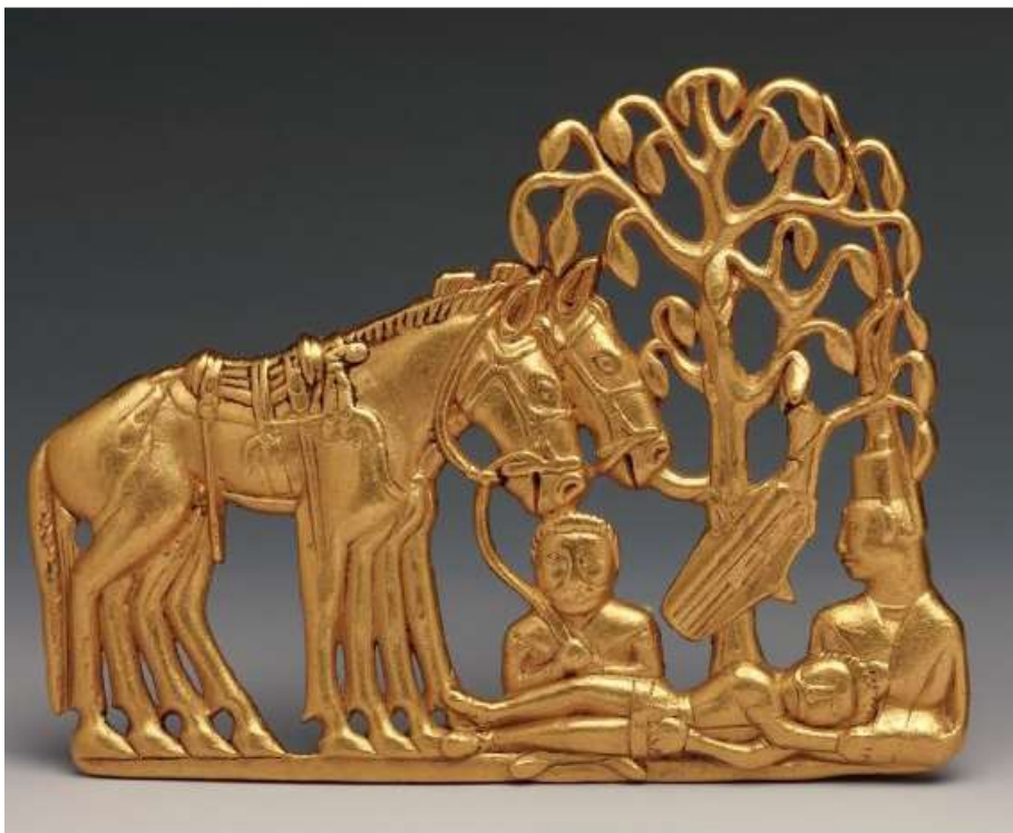
سگک زرین کمر بند که در سال ۱۷۱۶ فرماندار سیبری به نام گاگارین، از توپولسک آن را برای پتر بزرگ تزار روسیه فرستاد. دیرینگی این سگک سده چهارم یا سوم پیش از میلاد است و هم‌اکنون در موزه ارمنیاژ، سن پترزبورگ نگهداری می‌شود.

متن‌های تاریخی همچون تاریخ هرودت به باورها و اسطوره‌های این تیره می‌پردازد. فصل یازدهم کتاب راه مرگ نام گرفته است که نویسنده در این فصل به آیین خاکسپاری تیره سکایی می‌پردازد؛ آیینی ویژه که در نوشته‌های تاریخی بازتاب یافته است. این رسم و راه خاکسپاری سکاها نه تنها در میان مردمان دیگر تیره‌ها زبازند بوده بلکه در دوره حاضر نیز چشم‌های پژوهشگران به ویژه باستان‌شناسان را به خود خیره کرده است. خاکسپاری‌هایی که در آن مرده را همراه با اسب‌های چندی به خاک می‌سپردند. نویسنده که خود باستان‌شناس است به خوبی از یافته‌های باستان‌شناسی مرتبط با سکایان در این کتاب بهره برده است چنانکه فصل‌های این کتاب با تصویر یافته‌های باستان‌شناسی آذین شده است که افزون بر جلوه چشم‌نوازی که به کتاب داده است، خواننده را با شمایل‌نگاری و هنر این تیره آشنا می‌کند. نویسنده در پایان کتاب به معرفی و توصیف شماری از گورآوندهایی سکایی می‌پردازد و نقش مایه‌های آنها را به کوتاهی بررسی می‌کند. کانلیف در این کتاب فرهنگ ارزنده سکاهای خانه‌به‌دوش را در گستره‌ای از چین تا اروپا براساس متن‌های تاریخی و نیز کاوش‌های باستان‌شناسی که از سالیان دور در قلمرو آنان انجام گرفته است، بررسی و تلاش می‌کند تا تصویری درخور از آنان ارائه کند.