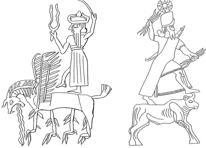
تصویر ۵ (Black and Green 1992, p.118)