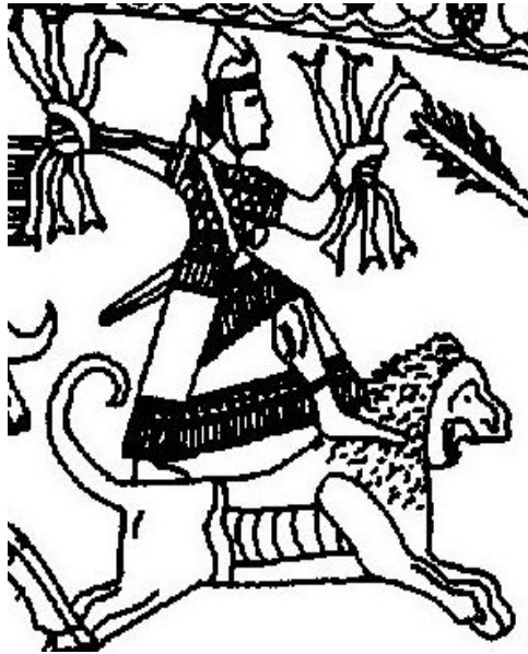
تصویر ۲ (Belli 1999)