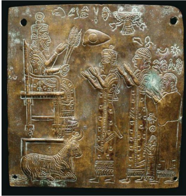
تصویر ۳ (Barnett, 1974: PLATE XI)