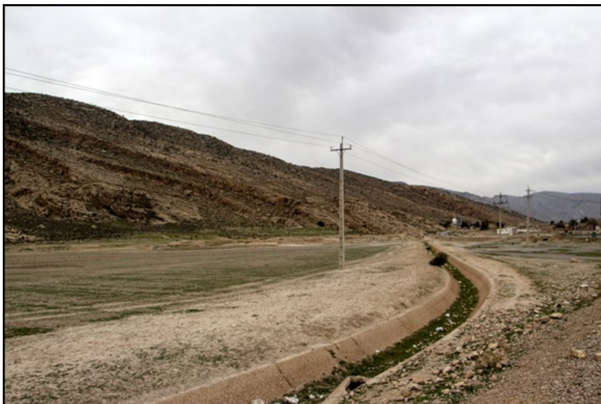
تصویر ۷. محل (؟) کشف پایه‌ستون، محوطه تپه قلعه جلودر، دید از شرق