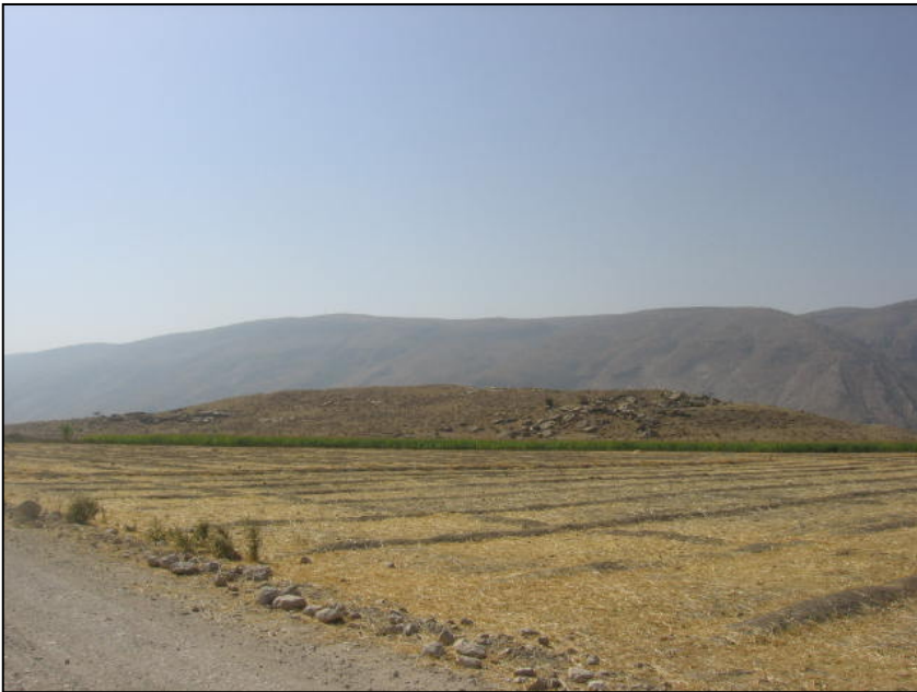
تصویر ۴. نمای کلی تُل قلعه، دید از شمال شرقی