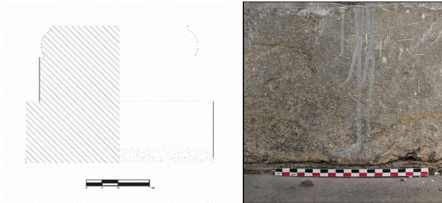
تصویر ۹. اثر ابزار شانه‌دندانه‌ای بر پله پایین پایه‌ستون