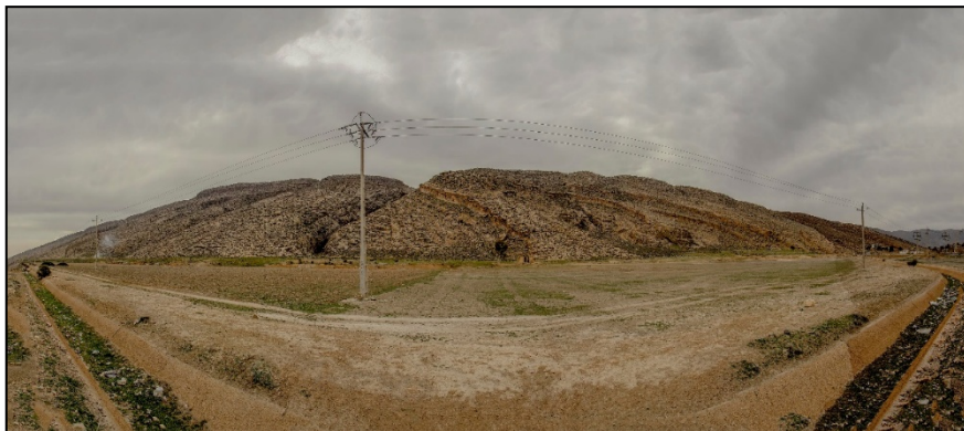
تصویر ۶. محوطه تپه قلعه جلودر، دید از شمال شرقی