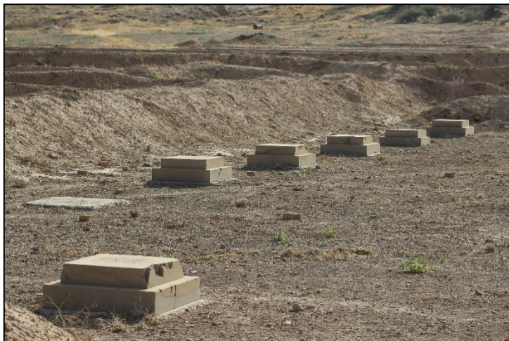
تصویر ۱۰. ایوان جنوبی، برزن جنوبی، تخت جمشید