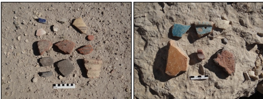
تصویر ۵. نمونه‌ای از سفال‌های سطحی تُل قلعه