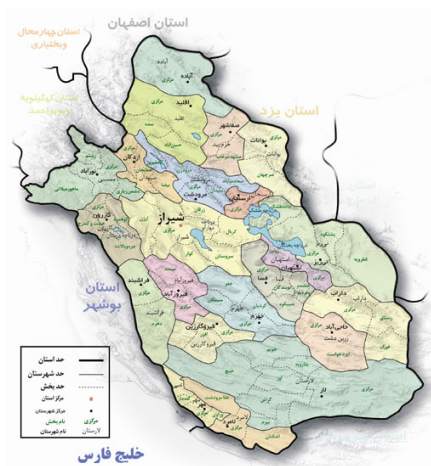
تصویر ۱. موقعیت جغرافیایی شهرستان ارسنجان