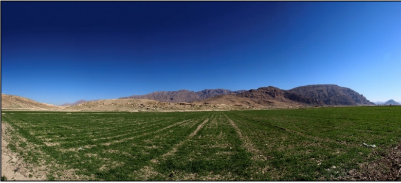
تصویر ۳. محوطه تپه قلعه جلودر، دید از جنوب