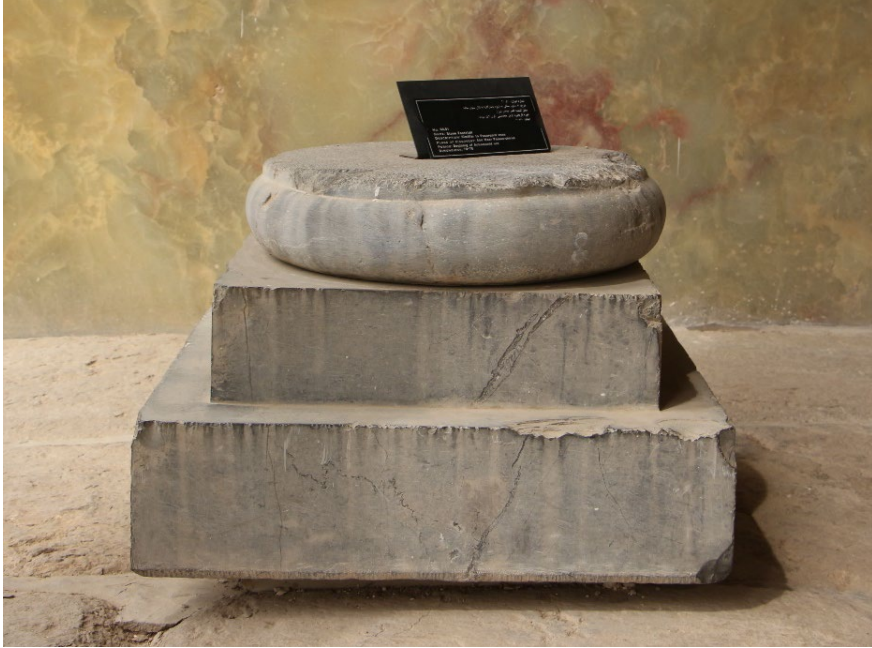
تصویر ۱۳. پایه‌ستون به‌دست‌آمده از محوطه قصر ابونصر، موزه سنگ (موزه هفت تنان) شیراز