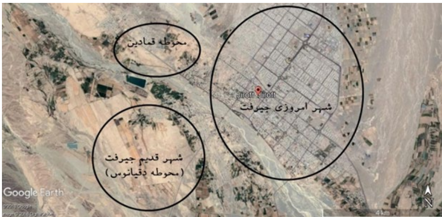
تصویر ۱. عکس ماهواره‌ای قمادین، شهر اسلامی جیرفت و شهر امروزی جیرفت (Google Earth)