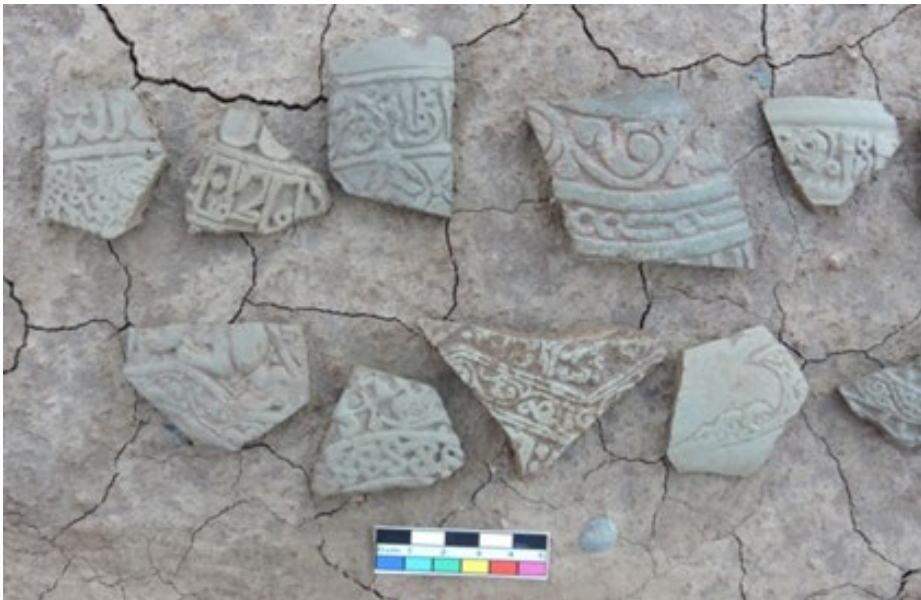
تصویر ۴. گونه سفال قالب‌زده بدون لعاب از قُمادین (نگارنده، ۱۳۹۸)