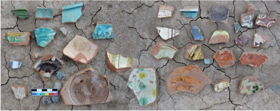
تصویر ۳. گونه‌های سفال لعابدار صدر اسلام تا سده هفتم هجری از قُمادین (نگارنده، ۱۳۹۸)