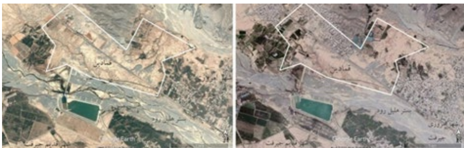
تصویر ۲. راست: محوطه قمادین بعد از توسعه روستاهای نارجو و رهجرد