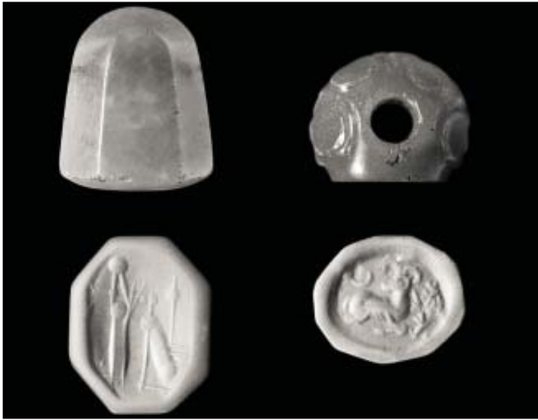
شکل ۲. مهرهای استامپی بابل نو (قرن ۷ پیش از میلاد) و ساسانی (قرن ۴ پیش از میلاد)

۱. (Whitcomb 1985: 87ff8, 1975: 15) آنها در اتاق‌های کوچک معبدها، کاخ‌ها و قلعه‌ها نگهداری می‌شدند. این اتاق‌ها به‌عنوان بایگانی استفاده می‌شدند که در شرق نزدیک باستان عمدتاً در اتاق‌های کوچک مجتمع‌های عظیم معماری قرار داشتند و مملو از لوح‌های میخی و همچنین مهر و موم‌های سفالی بودند. ۲ تعداد زیادی از ۱۰۰ تا ۵۰۰ گل‌مهرها در یک اتاق از یک محوطه ساسانی نشان می‌دهد که این گل‌مهرها عمدتاً برای مهر و موم اسناد کتبی استفاده می‌شدند، یا از اشیایی که به آنها متصل بودند، زدوده می‌شدند. محصولات یا کالاهای تجاری نمی‌توانست در چنین اتاق‌های کوچک در مقادیر زیادی نگهداری شود، بنابراین گل‌مهرها ممکن است پس از حذف، در این اتاق‌ها بایگانی شده باشند.