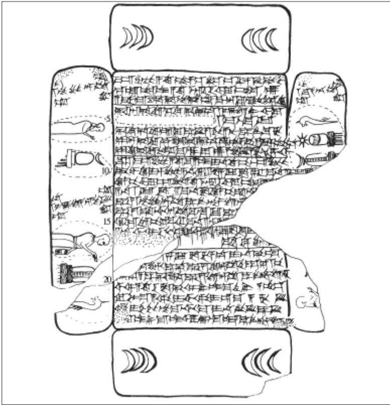
شکل ۴. قرارداد بابل نو دربارهٔ املاک و مستغلات بابل (از Wunsch 2000: 273).

لوح پلمپ می‌کردند، درحالی‌که شاهدان و خریداران مهرهای خود را در قسمت باریک، پایین یا سمت چپ می‌زدند (Oelsner 1978: 167ff). براساس متون حقوقی از بایگانی‌های آگیبی ۱ در بابل، کلودیا ونش تشخیص داد که بالاترین مقام شرکت‌کننده، غالباً یک قاضی، مهر خود را در قسمت باریک سمت چپ سند قرار می‌داده است (Wunsch 200a: 560). این سیستم مهر و موم روی متون حقوقی و قراردادهای فروش املاک و مستغلات استفاده می‌شد و مدت‌ها پس از فتح بین‌النهرین و ایران توسط اسکندر در سال ۳۳۱ پیش از میلاد هنوز در اسناد میخی استفاده می‌شد. آخرین سند میخی که به این روش پلمپ شده است، یک متن قانونی از اوروک است که در سال ۱۰۸ پیش از میلاد مسیح به ثبت رسیده است (Kes-1984). از گل رس تا کاغذ پوستی: تغییر در نوشتار و مدیریت در هزاره اول پیش از میلاد، سیستم‌های نوشتاری در بین‌النهرین نه تنها به خط میخی اکدی نوشته می‌شد، بلکه زبان آرامی و سایر زبان‌های الفبایی که روی کاغذ پوستی، پاپیروس یا چرم نوشته می‌شدند را نیز شامل می‌شد. اگرچه همهٔ اسناد بر مواد فاسد شدنی نوشته شده و از بین رفته‌اند، ما یک سیستم سلسله‌مراتبی را پیدا کرده‌ایم که با نمونه‌های استفاده شده در لوحه‌ها همچنین روی گل‌مهرهای گلی که برای مهر و موم کردن اسناد از آنها استفاده می‌شد، از نظر تصویر، مکان، میزان