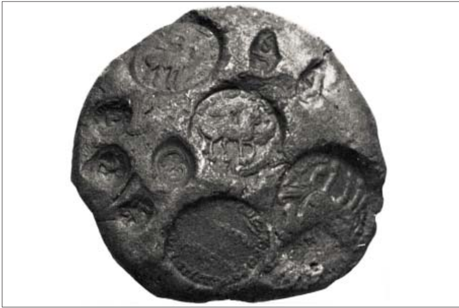
شکل ۳. اثر مهر روی یک گل مهرگلی ساسانی از تخت سلیمان، ایران (from Göbl 1976: Pl. 12, Nr. 63/106).

لوحه می‌فشرده. در زمان پادشاه نبوکدنصر دوم (۶۰۴-۵۶۲ پیش از میلاد)، مهرها معمولاً با کتیبه‌ای کوتاه همراه بودند که به ما این امکان را می‌دهد که شرکت‌کنندگان در معامله را بازسازی کنیم: قاضی، فروشنده و خریدار. دومی غالباً با ناخن انگشت خود مهروموم می‌کرد که به زبان اکدی به نام سوپراخوانده می‌شود (-Her bordt 1992: 41; Wunsch 2000: 38). متعاقب آن در دوره هخامنشی، مهروموم روی قراردادهای بایگانی کردن آنها در بابل به سرعت افزایش یافت. در حال حاضر ما اثر مهرقضا، دفاتر اسناد رسمی، خریداران، فروشندگان، شاهد و کاتب را پیدا کرده‌ایم، درحالی‌که اثر مهرهای ناخنی در حال از بین رفتن هستند. یواخیم اولسندر دریافت که شرکت‌کنندگان در عمل مهروموم، یک سیستم سلسله‌مراتبی را توسعه داده بودند. فروشنده و ضمانت‌کنندگان وی، این سند را قسمت باریک در سمت راست