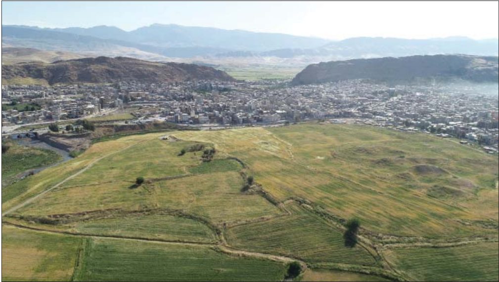
تصویر ۳. ویرانه‌های شهر حلوان (قلعه گبری سرپل زهاب)

(علی‌بیگی، ۱۳۹۴)، هیچ محوطه دیگری که بتوان آن را گزینه مناسب برای انطباق با گزارش راد و فرای دانست، پیرامون شهر سرپل زهاب وجود ندارد. علاوه بر اینها ویرانه‌های قلعه گبری، بقایای ساده و محقر روستایی نیست، بلکه این محوطه بقایای ویرانه‌های بزرگ و وسیعی بوده که به احتمال فراوان همان شهر حلوان دوره ساسانی/ اوایل اسلام بوده است و در چنین محوطه‌ای است که می‌توان انتظار داشت یافته‌هایی چون ظروف سیمین مورد اشاره فرای و راد نیز کشف شود.