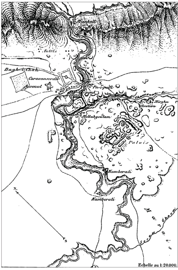
تصویر ۲. نقشهٔ دمورگان از سرپل‌زهاب و ویرانه‌های حلوان (Morgan, 1895, cartes)

در نهایت با اطلاع افراد محلی به پیرامون کوه بمو رفت و از مکانی که گویا پیشتر اشیایی توسط مردم در آن کشف شده بود، بازدید کرد. راد در همان سال اطلاعات بسیار خلاصه‌ای از این سفر اکتشافی را در مجله گزارش‌های باستان‌شناسی منتشر کرد و در آن نوشته به کشف ظروف سیمین سرپل‌زهاب اشاره کرد (ن.ک: راد ۱۳۳۴: ۳۱۵، و ۳۱۶، شکل ۸). راد نوشته است: «در حین این مأموریت [مأموریت غرب ایران] مناسب بود برای بازدید خرابه‌های پل ذهاب که از آثار دوره ساسانی می‌باشد و شایع بود که ظروف نقره قابل توجهی در آن حدود قبلاً به دست آمده است تحقیقاتی در حول و حوش آنجا به عمل آورد- خرابه‌های پل ذهاب آثار یک شهر بزرگ دوره ساسانی است که در اطراف قصبه کنونی قرار گرفته و تاکنون توجهی به آن نشده و مدت‌ها است از طرف اهالی برای تهیه مصالح ساختمانی از قبیل آجر و سنگ مورد کاوش قرار گرفته و گاهی هم به آثاری برخورد می‌نمایند که به وسیله دلالان عتیقه خریداری می‌گردد. هر چند در این محل آثار و اشیاء فراوانی به دست نمی‌آید، ولی به طور تصادف ظروف نقره قابل توجهی از دوره ساسانی بیرون آمده که از لحاظ جنبه صنعتی جزو شاهکارهای نقره سازی زمان خود بوده است که متأسفانه تاکنون موزه ایران باستان از آنها بی اطلاع مانده و نمونه آنها را در دست