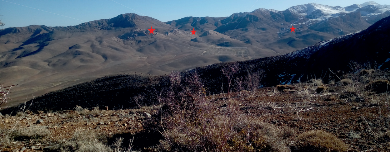
تصویر ۲. محوطه ادارگ، معادن اطراف این محوطه با ستاره قرمز مشخص شده است.

هویت جمعی شکل می‌دهد (دهقانی، ۱۳۹۰: ۱۳۷). برای پایداری و بقای فرهنگ ایرانی، باید به میراث فرهنگی اهمیت داد. زنده نگه داشتن میراث فرهنگی، به معنی نادیده گرفتن تحولات جهان امروز نیست، بلکه مراد از آن ارزیابی مجدد این میراث با معیارهای تازه و بازیافتن عناصر زنده و دوام‌پذیر آن است. حفظ و توجه به میراث فرهنگی مستلزم شناخت و شناساندن میراث فرهنگی گرانقدر ایران است (مرادی، ۱۳۹۰: ۷۳).