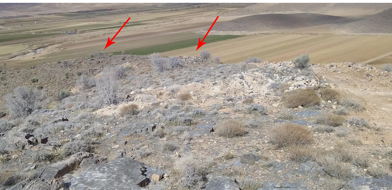
تصویر ۶. وضعیت آثار در محوطه تنگ گنجک

اعلام کرد (ایمانیان، ۱۳۹۸). پس از چندین سال صرف وقت و هزینه و تخریب بخش بسیاری از منابع طبیعی و میراث فرهنگی کشور در نهایت شرکت معدن کار محکوم می شد. آیا قبل از صدور مجوز برای فعالیت معدن کاری، از میراث فرهنگی استعلام گرفته شده بود؟ با