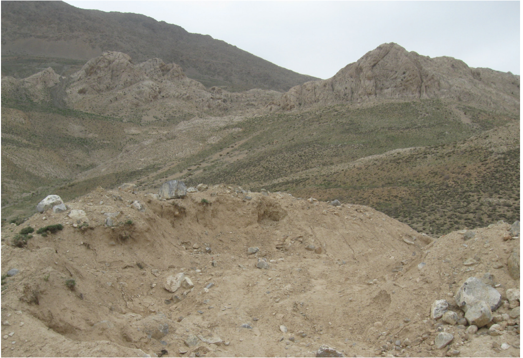
تصویر ۴. بقایای بنای خشتی در محوطه ادارگ که بخش‌های از آن با ادوات مکانیکی تخریب شده است.

در صورتی که لزوم توقف عملیات، عدم تمدید مجوز، جابه‌جایی معادن و پاکسازی منطقه در جلسات متعدد با سرپرست پروژه با مدیران استان مطرح و توافق‌هایی نیز صورت گرفته بود، با وجود پیگیری‌ها هیچ‌گونه اقدامی صورت نگرفته است (خبرآنلاین، سه‌شنبه ۱۷ فروردین ۱۳۹۵).