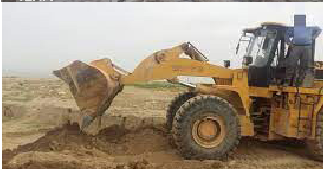
تصویر ۱۲. تخریب محوطه جویبجی

مؤثر در گسترش روابط بین ملت‌ها و ایجادکننده فرصت‌های شغلی و تعاملات اجتماعی-فرهنگی (Sariisik, et al 2001) و یکی از بزرگ‌ترین و سریع‌ترین بخش‌های اقتصادی در حال رشد است (Hamilton, et al 2005). از این رو در کشورهای در حال توسعه، گردشگری به عنوان منبع ارزشمندی برای ایجاد رشد و توسعه و کسب درآمد مورد توجه قرار گرفته است (Andrades, Dimanche, 2017) کشور ایران با برخورداری از سابقه دیرین