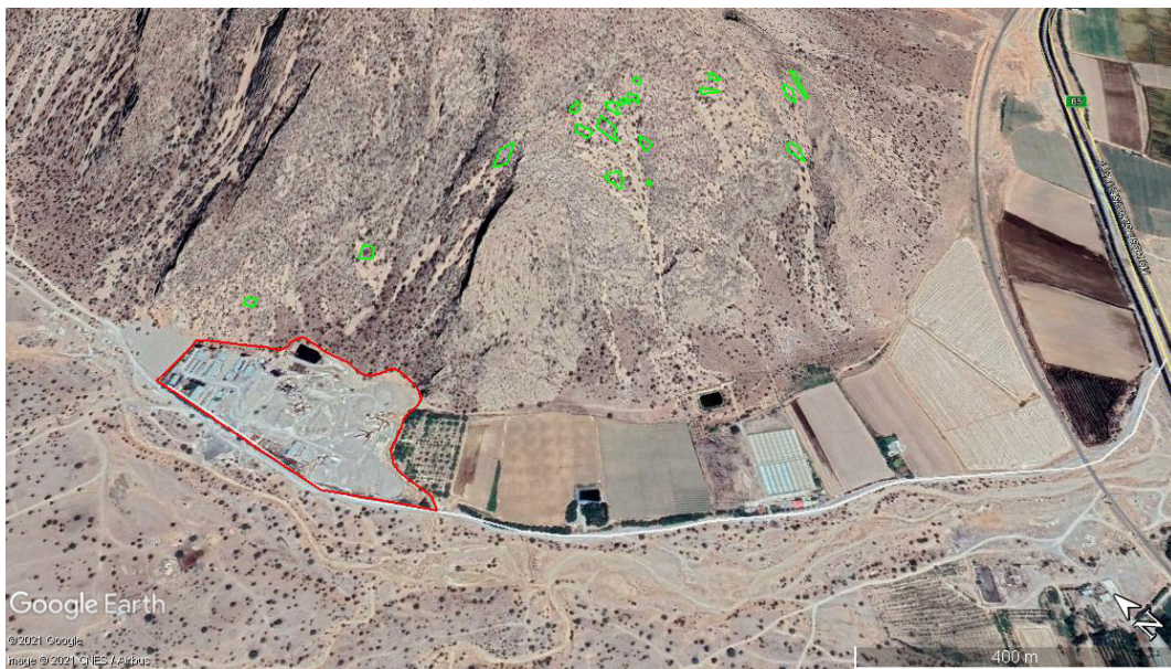
تصویر ۹. موقعیت کارگاه‌های معدن سنگ هخامنشی الماس‌بری با رنگ سبز و محدوده، معدن شن و ماسه با خط قرمز مشخص شده است.