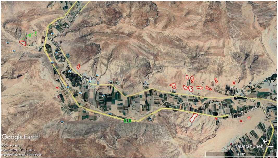
تصویر ۸. محدوده‌هایی که با رنگ قرمز مشخص شده، مجوز استخراج سنگ صادر شده است.

را تخریب کرده است (تصویر ۱۳). گذشته از آثار شناسایی نشده، آثار ارزشمندی هم که ثبت ملی شده، در امان نبوده و مورد تخریب قرار گرفته است. پیر بکران این بنای ارزشمند تاریخی به قدری مهجور مانده که به آن به چشم یک ساختمان کهنه نگاه می‌شود. فعالیت یک شرکت معدنی در نزدیکی این بنا و متعاقب آن استفاده از مواد منفجره به جهت استخراج آهک، باعث ایجاد شکستگی‌ها و ترک‌های زیادی بر دیواره‌ها و فرو ریختن گچبری‌ها و کاشی‌کاری‌های بنا شده است. بدون شک وجود معدن سنگ روبه‌روی این مجموعه باستانی و انفجارهای به‌وجود آمده می‌تواند به تسریع در تخریب این اثر کمک کند. مجموعه پیر بکران جزو مهم‌ترین آثار تاریخی کشور و درعین‌حال ناشناخته استان اصفهان است که می‌تواند از یکی از بهترین پتانسیل‌های گردشگری این استان باشد (قدس‌آنلاین، یک‌شنبه ۱۵ اردیبهشت ۱۳۹۲). زمانی که در منطقه‌ای کار یک معدن شروع