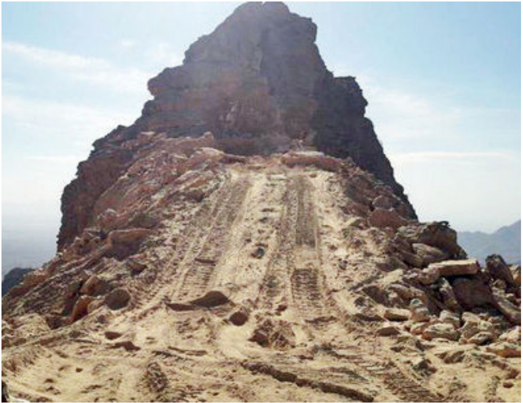
تصویر ۱. معدن کاوی در محدوده قلعه سموران

به معنی بازآفرینی مناسبت‌ها و هویت‌ها پس از رویارویی با تهدیدها نیز به‌کار می‌رود. تداوم ناشی از پیوستگی و قابلیت بازآفرینی را می‌توان به‌منزله وجود سطح مناسبی از حاشیه جغرافیایی و به تبع آن امنیت ملی دانست، از لوازم تحقق این سطح از انسجام فرهنگی، تداوم نمادی است (پورسعید، ۱۳۹۹). آثار فرهنگی در کشور ما مهم‌ترین اسناد هویت و وفاق ملی به‌شمار می‌آیند و طبیعتاً می‌تواند آموزه‌های مناسبی برای همه اعصار و اقوام باشد. هویت جمعی برای شناساندن خود به کارویژه‌ای به نام خاطره جمعی نیاز دارد و این خاطره در هیئت سنن، انگاره‌ها، آیین‌ها و حتی رمزهای شخصیتی که در سرشت هویت جمعی نهفته است به کلیت روایت