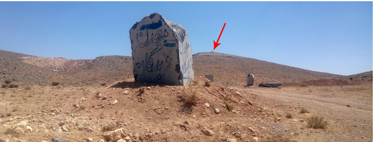
تصویر ۱۳. تعدادی از معادنی که در گردنه دیدگان و در حریم و عرصه گورهای ثبت ملی دیدگان در حال فعالیت هستند. در تصویر سمت چپ آثار و بقایای یک بنا و در تصویر سمت راست یک گور توده سنگی که با علامت قرمز نشان داده شده، در فاصله نه چندان دور از محل برداشت معدن قابل مشاهده است.

برای گردشگری و هدف‌های دیگر مورد استفاده قرار می‌گیرند (تیموتی، ۲۰۰۱: ۱۵). توسعه این نوع از گردشگری باعث فراهم آوردن منافعی برای گردشگران، ساکنان محلی و مقصدهای میراث می‌شود. جوامع مختلف سعی دارند تا با استفاده از توسعه گردشگری میراث بتوانند فرهنگ و منابع تاریخی-فرهنگی خود را به دنیا عرضه کرده و برای توسعه اجتماعی، اقتصادی و سیاسی کشور خود گام بردارند (صالحی‌پور، ۱۳۹۴: ۲۲). تقاضا برای گردشگری میراث از دهه ۱۹۹۰ به سرعت افزایش یافته و در قرن بیست‌ویکم به اوج خود رسیده است. ۱۸ تا ۲۵ درصد از انگیزه گردشگران، جنبه تاریخی-فرهنگی دارد و پیش‌بینی می‌شود