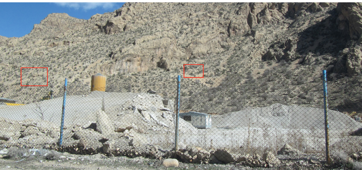
تصویر ۱۰. موقعیت کارگاههای معدن سنگ هخامنشی الماسبری با رنگ قرمز و معدن جدید شن و ماسه.

در حال تخریب و نابودی است. در حریم معدن هخامنشی الماسبری، یک معدن جدید شن و ماسه در حال فعالیت است (تصویر ۹) و حریم منظر و چشم‌انداز فرهنگی-طبیعی این اثر بی نظیر را به شدت مخدوش کرده است (تصویر ۱۰). معدن الماسبری متأسفانه در معرض آسیب‌ها و تخریب‌های گوناگونی است. در سال ۱۳۹۷ عده‌ای متوهم به خیال‌واهی گنج‌یابی بخش‌های یکی از کارگاه‌های این معدن ارزشمند را تخریب کرده و با مواد منفجره