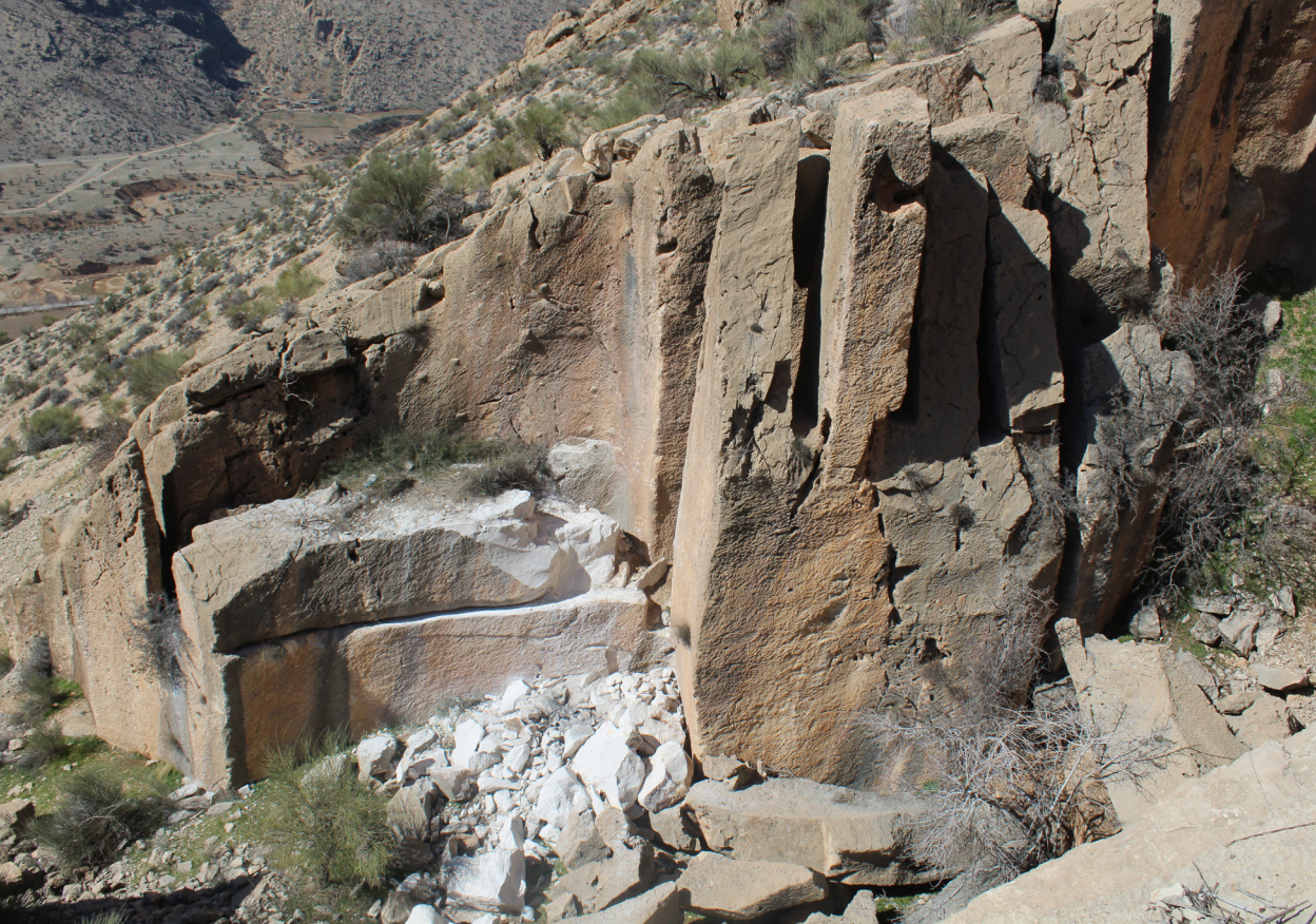
تصویر ۱۱. تخریب بلوک سنگی معدن الماس‌بری توسط عده‌ای متوهم گنچ‌یاب در سال ۱۳۹۷

کرد (ایمانیان، ۱۳۹۸). در این بین معدن‌کاوان بدن توجه به وجود محوطه ارزشمند جوبجی، شروع به راه‌سازی و تخریب این محوطه کردند (تصویر ۱۲).