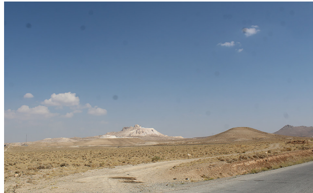
تصویر ۱۴. بخشی از معادن کوه سفید دهبید، گوشه کوچکی از تخریب محیط زیست و تغییر و تخریب چشمانداز منطقه.

کرده‌ایم. در دورهٔ معاصر ما متوجه نبوده‌ایم که ایران ذاتاً یک واحد طبیعی و تاریخی و فرهنگی است و تنوع فرهنگی را مخل وحدت ملی دانستیم و درصدد برآمدیم برای حفظ وحدت، این تنوع را به حاشیه برانیم. به سخن دیگر تنوع فرهنگی در ایران را نه یک فرصت بلکه تهدید شمردیم و با تعریف هویتی معیار بقیهٔ تنوع را به میزان تفاوت با این هویت معیار تحقیر کردید. خلاصه آنکه ما در دورهٔ اخیر و کاملاً با برنامه‌ریزی و مدیریت، آرایش طبیعی و فرهنگی و زیستی سرزمین مان را بر هم زده‌ایم و امنیت آن را به مخاطره انداخته‌ایم. اکوسیستم حساس و منحصر به فرد سرزمین مان را تخریب کرده‌ایم. ظرفیت‌های بالقوه را فراموش و آنچه با زحمت و طی سده‌ها از قوه به فعل آمده بود دوباره محجوب کردیم (بهشتی، ۱۳۹۸: ۱۸). طی سال‌های اخیر به بهانه توسعه و پیشرفت