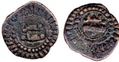
تصویر ۱۱. سکه مسی غزنوی بهرام شاه، دفتر هند، IOLC.6654، ۱/۶۰ گرم، ۱۲ میلی‌متر