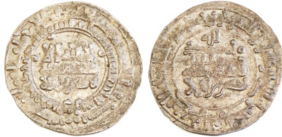
تصویر ۱. درهم نقره‌ای سامانیان، نصر بن احمد، ضربخانه پروان، ۳۱۴ ه.ق.، موزه بریتانیا ۲۱/۰۳۲۰، ۱۹۱۷، ۲/۹۲ گرم، ۲۹ میلی‌متر

bert 1836: 476). توصیفات الادریسی به خوبی با مکان محوطه بگرام، در کرانه غربی رودخانه پنجشیر و امتداد رودخانه غوربند مطابقت دارد.