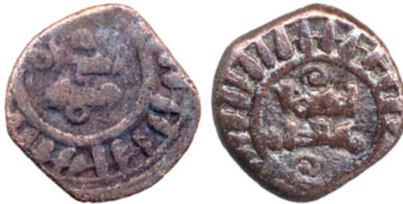
تصویر ۶. سکه مسی غزنوی از مسعود بن ابراهیم سوم، دفتر هند، IOLC.6383، ۲/۸۱ گرم، ۱۰ میلی متر