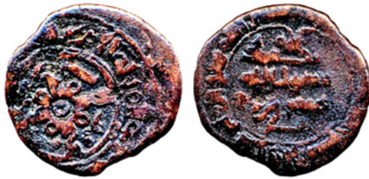
تصویر ۲. سکه مسی نصر بن احمد، تحت سلطنت منصور بن نوح، ضرابخانه فروان، ۳۶۵ ه.ق. مجموعه دفتر قرضی هند IOLC.6785، ۱۸/۱۸ گرم، ۱۸ میلی متر

اندراب یکی از مهمترین منابع نقره در جهان قرون وسطی بود و ضرابخانه‌ها در هر دو شهر سکه‌های نقره‌ای را تهیه می‌کردند که حتی در مناطق دوردست‌ها مانند وایکینگ‌ها در شمال اروپا پیدا شده است (به‌عنوان مثال Noonan 1977: 247-248، مورخ ۳۱۴، ۳۱۵ و ۳۲۳ هجری قمری، در استونی پیدا شده است). با از بین بردن بگرام توسط مغولها و استخراج معادن این مناطق، شهر ناپدید شد (Merkel et al. 2013). زمانی که حکومت صفاریان به پایان رسید، سلسله سامانیان توسط اسماعیل روی کار آمد. او احمد را در سال ۹۰۰ م به اسارت گرفت، بنابراین منطقه کابل تحت حکومت سامانیان درآمد. هیچ سکه‌ای از این دوره در مجموعه ماسون از بگرام وجود ندارد، اما سکه‌های نقره سامانی در ضرابخانه فروان ساخته شده‌اند، این سکه‌ها عبارت اند از: درهم‌های اسماعیل بن احمد (۸۹۲-۹۰۷ م.) مورخ ۲۹۲ و ۲۹ ق، احمد بن اسماعیل دوم (۹۱۴-۹۰۷ م.) مورخ ۲۹۶، ۲۹۷، ۲۹۹، ۳۰۰ هجری قمری و نصر بن احمد دوم (۹۱۴-۹۴۳ م.) مورخ ۳۰۳، ۳۰۸، ۳۱۳، ۳۱۴ ق. (تصویر ۱) (Diler 2009, II: 891; Schwarz 1995: 64, nos. 686-693).