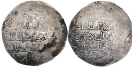
تصویر ۱۸. درهم نقره‌ای شاه خوارزمشاه محمد بن تکیش علاالدین، ضرابخانه فروان، تاریخ هجری قمری ۶۱۷، موزه بریتانیا 1982,0206.3، ۵/۵۵ گرم، ۳۱ میلی‌متر

حاکمی از آن است که فروان نام شهر باستانی در محوطه بگرام در دوره اسلامی بوده است. مسافران و دوره‌گردان معاصر همه توصیف می‌کنند؛ این شهر، بعد از عبور از کوه‌های هندوکش به سمت جنوب در حاشیه رودخانه پنجشیر، به سمت رودخانه کابل قرار دارد که آب رودهای آن سرانجام به سند سرازیر می‌شود. نویسندگان بعدی اما مکان متفاوتی را برای فروان پیشنهاد می‌کنند. ماسون، فروان را به‌عنوان یک شهر به‌نسبت بزرگ، در حدود ۱۲ کیلومتری شمال محوطه بگرام باستان با نام پروان شناسایی کرد: «بگرام، شهر بزرگی که در حدود هشت مایلی، با شمال غرب پروان امروزی وجود داشت که به دامنه سلسله‌کوه‌های فققاز نزدیک بوده و از این محدوده، به تعداد زیادی سکه کشف می‌شوند...» (Masson 1844, III: 166). او به شهری اشاره می‌کند که در ورودی گذرگاه سالنگ در لبه شمالی دشت بگرام واقع شده است، شهری که اکنون به جبل السراج معروف است.