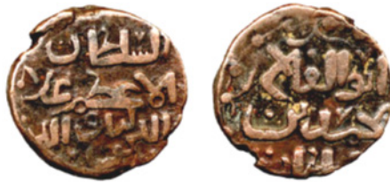
تصویر ۲۰. سکه مسی خوارزمشاه محمد بن نکیش علاالدین، بدون نام ضرابخانه، بدون تاریخ، مجموعهٔ دفتر هند IOLC.7306، ۰۱/۰۳ گرم، ۱۵ میلی‌متر

ما به کوهی به نام پاشای ۳ رسیدیم ... سپس، از آنجا به پروان سفر کردیم، جایی که من امیر بورونتای ۴ را ملاقات کردم. او با من رفتار خوبی داشت و به نمایندگان خود در غزنه نامه نوشت تا آنها را به من نشان دهند. ما به روستای چرخ [چاریکار] رفتیم که اکنون تابستان است و از آنجا به شهر غزنه رفتیم. فرمانورای این شهر، سلطان سلحشور مشهور به محمود بن سبکتین، یکی از بزرگ‌ترین حاکمان غزنوی است که به هند حمله کرد و شهرها و قلعه‌های آنجا را به تصرف خویش درآورد» (Gibbs 180-179: 1929). آخرین سکه شناخته شده با نام ضرابخانهٔ فروان، باید مربوط به شهری باشد که این بطوطه از آن بازدید کرده است زیرا در سال ۸۳۹ هجری قمری (۱۴۳۵/۶ م) تحت حکومت تیموری قرار گرفت (Diler 2009, II: 892)، مدت‌ها پس از شهر بگرام ناپدید شد.