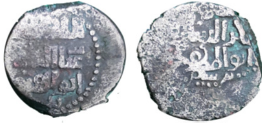
تصویر ۱۲. درهم نقره‌ای غوری، غیاث‌الدین محمد بن سام و برادرش معزالدین محمد بن سام، ضربخانه فروان، تاریخ ناخوانا، موزه فیتز ویلیام CM 769.1996، ۲/۸۲ گرم، ۲۰ میلی‌متر

شناخته شده است (نگاه کنید به تصویر ۱۲). هیچ نمونه‌ای از این نوع در بین کلیکسیون موزه بریتانیا و کتابخانه بریتانیا ماسون وجود ندارد، اما مثالی در موزه فیتز ویلیام وجود دارد (CM 769.1996) این سکه‌ها پس از سال ۱۱۷۳ ضرب شدند، زیرا بعداً در سال ۱۱۹۲ ضربخانه فروان تحت اختیار غوریان بامیانی ۱ درآمد. دو گونه نقره‌ای از این سکه‌ها در فروان ضرب شدند: شمس‌الدین محمد بن مسعود (۱۱۶۳-۱۱۹۲) و بهالدین سام بن محمد (۱۱۹۲-۱۲۰۶) (Schwarz 1995: 68-69; nos. 787-788; Muhammad: no 786; Baha 1995: 114, type 153, Tye 1995: 137). تاریخ قرائت این دو سکه نقره از بهالدین ۱۱۹۸/۹ میلادی است (Schwarz 1995: nos. 787-788). انتقال از غیاث‌الدین به غوریان بامیان پس از سال ۱۱۸۰ صورت گرفت، زیرا محمد خلیفه‌الناصر (۱۱۸۰-۱۲۲۵) نام خود را روی سکه‌هایی از ضربخانه فروان نهاد. تنها سکه‌های مسی قابل