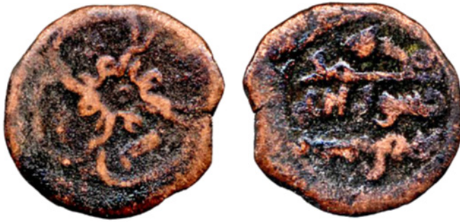
تصویر ۳. سکه مسی نصیر بن احمد، تحت سلطنت نوح بن منصور دوم، ضربخانه فروان، تاریخ ناخوانا، مجموعه دفتر هند IOLC.6783، ۰۶/۲ گرم، ۱۷ میلی متر