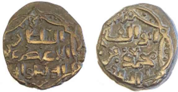
تصویر ۱۹. سکه مسی شاه خوارزمشاه محمد بن نکیش علاالدین، ضرابخانهٔ فروان، بدون تاریخ، موزه بریتانیا 1881,1202.3، ۰۳/۰۳ گرم، ۱۵ میلی‌متر