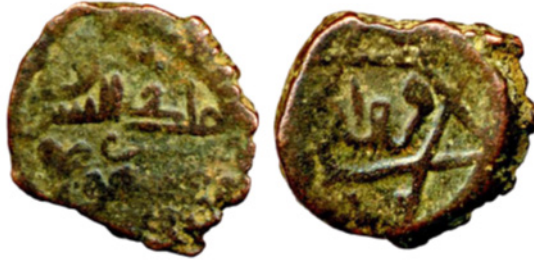
تصویر ۱۶. سکه مسی ناشناس منتسب به تاج‌الدین یلدیز، فرمانروای غوری، ضرابخانه فروان، تاریخ ناخوانا، مجموعه دفتر هند، IOLC.7423، ۸۴/۲ گرم، ۱۴ میلی‌متر

محمد در مجموعه ماسون از یک گونه بدون نام ضرابخانه بوده و به غزنه نسبت داده شده است (Schwarz 1995: 58-61, nos. 612-645; Tye 1995: 133 گونه 283)، اما به نظر می‌رسد، مبنای کشف آنها در تعداد زیادی در بگرام که باید دوباره به ضرابخانه فروان اختصاص داده شوند. فقط یک نمونه از نوع مس با نام ضرابخانه فروان در میان مجموعه ماسون وجود داشته (IOLC.7328, Tye 1995: 133) گونه 278) و دو نمونه دیگر از مجموعه ماسون در موزه فیتز ویلیام نیز وجود دارد (CM-IS.0482) گونه 278) کنترل خوارزمشاهیان بر منطقه بگرام کوتاه‌مدت بود، در سال ۱۲۲۱ هنگامی که ارتش مغول، به فرماندهی یکی از ژنرال‌های چنگیزخان، به منطقه رسید، از دست آنان خارج شد. مانگوبارنی توانست در نبرد پروان از حمله مغولان دفاع کند، اما این امر موجب خشم و تلافی چنگیزخان گردید و مانگوبارنی مجبور به فرار شد. سرانجام، چنگیزخان او را گرفت و در نبرد سیند شکست داد. ورود چنگیزخان