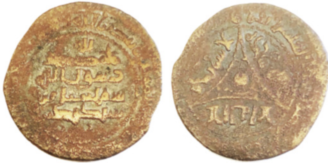
تصویر ۵. سکه مسی غزنوی از اسماعیل بن سبکتگین، ضربخانه فروان، تاریخ ناخوانا، موزه بریتانیا، 1883، 1004.73. ۳/۱۱ گرم، ۲۵ میلی متر