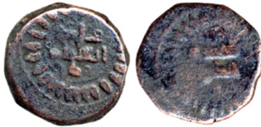
تصویر ۷. سکه مسی غزنوی از ارسلان شاه، دفتر هند، IOLC.6571، ۲/۸۱ گرم، ۱۳ میلی متر