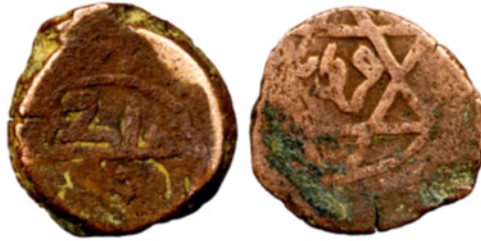
تصویر ۱۵. سکه مسی ناشناس منتسب به فرماندار غوریانی تاج‌الدین یلدیز، ضرابخانه فروان، تاریخ ناخوانا، مجموعه دفتر هند، IOLC.7421، ۳۸/۳ گرم، ۱۴ میلی‌متر