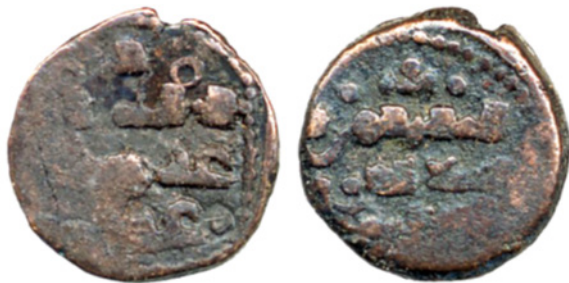
تصویر ۸. سکه مسی غزنوی از ارسلان شاه، دفتر هند، IOLC. 6536، ۱/۸۲، ۱۲ میلی متر