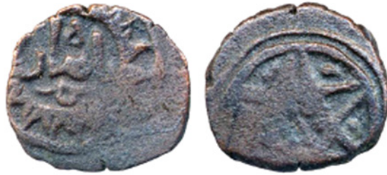
تصویر ۱۴. سکه مسی بی نام غوریان بامیان، ضرب بامیان، بدون تاریخ، مجموعه دفتر هند IOLC.7438، ۲/۰۷ گرم، ۱۴ میلی متر

این سکه‌ها، عنوان فقط توسط ژنرال غوریانی، تاج‌الدین یلدیز (۱۲۱۵-۱۲۰۶) بر سکه‌های طلا از ضربخانه‌ای در غزنه استفاده شد که روی آن المالک المعظم سلطان الشرق تاج الدنيا والدین یلدیز ۱ نوشته شده بود (Schwarz 1995, nos. 574, 575). ۶۹ مورد از ۸۳ سکه تاج‌الدین یلدیز (به استثناء هفت سکه مالک الشرق) موجود در موزه بریتانیا و کتابخانه بریتانیا از یک گونه واحد هستند (Tye 1995: 199 type 121)، این سکه‌ها، به جای اینکه در غزنه ضرب شده باشند، حکایت از ضرب فروان دارد. اگر این انتساب به مسکوکات فروان صحیح باشد، نشان می‌دهد که وی پس از مرگ بهالدین، از طرف غوریان بامیان، منطقه بگرام را به دست گرفته بوده است. تاج‌الدین یلدیز، به سرعت استقلال خود را از حاکمیت اسمی محمود غیاث‌الدین (۱۲۰۶-۱۲۱۲)، حاکم غوریانی غور، خارج کرد. وی تا زمان حمله