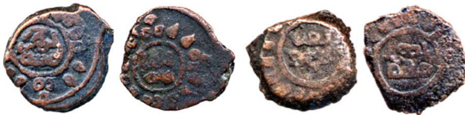
تصویر ۹. سکه مسی غزنوی ارسلان شاه، دفتر هند، IOLC. 6538، ۱/۹۷، ۱۱ میلی متر