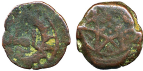
تصویر ۱۳. سکه مسی گمنام از غوریان بامیان، نوشته شده بامیان، بدون تاریخ، مجموعه دفتر هند، IOLC.7439، ۲/۴۸ گرم، ۱۳ میلی متر