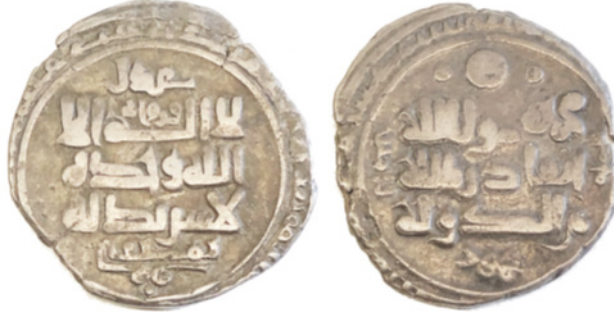
تصویر ۴. درهم نقره‌ای غزنوی از محمود بن سبکتگین، ضربخانه فروان، تاریخ ناخوانا، مجموعه دفتر هند موزه بریتانیا، IOC.1332، ۸۳/۳ گرم، ۱۹ میلی متر

هجری قمری (۹۶۸ م) (BM: IOC. 6021) و دیگری از نوح بن منصور دوم (۹۷۶-۹۹۷ میلادی) با تاریخ و ضربخانه نامشخص و سکه سوم که ناخوانا است.