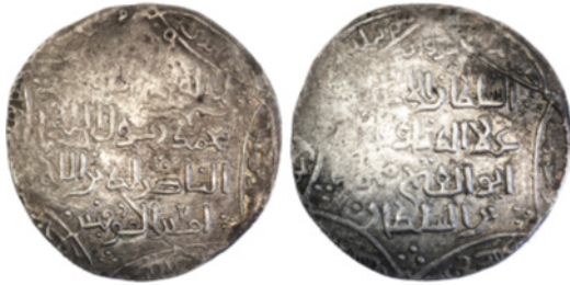
تصویر ۱۷. درهم نقره‌ای شاه خوارزمشاه محمد بن تکیش علاالدین، ضرابخانه فروان، تاریخ هجری قمری ۶۱۴، موزه بریتانیا 1982,0206.2، ۱۶/۶ گرم، ۳۲ میلی‌متر